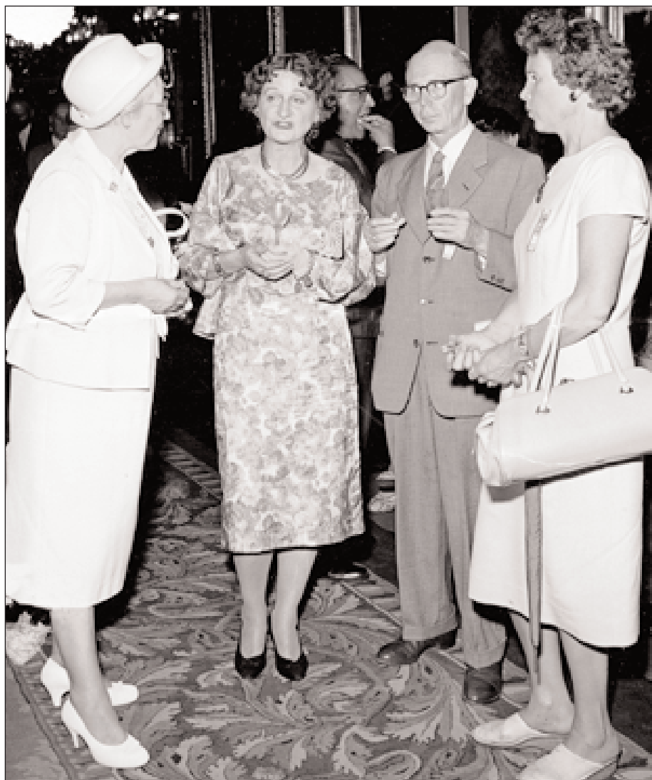
SVF fick egna lokaler i eget hus.

Tack vare Weimars donation inköptes fastigheten Rådmsgatan 88 i Stockholm.