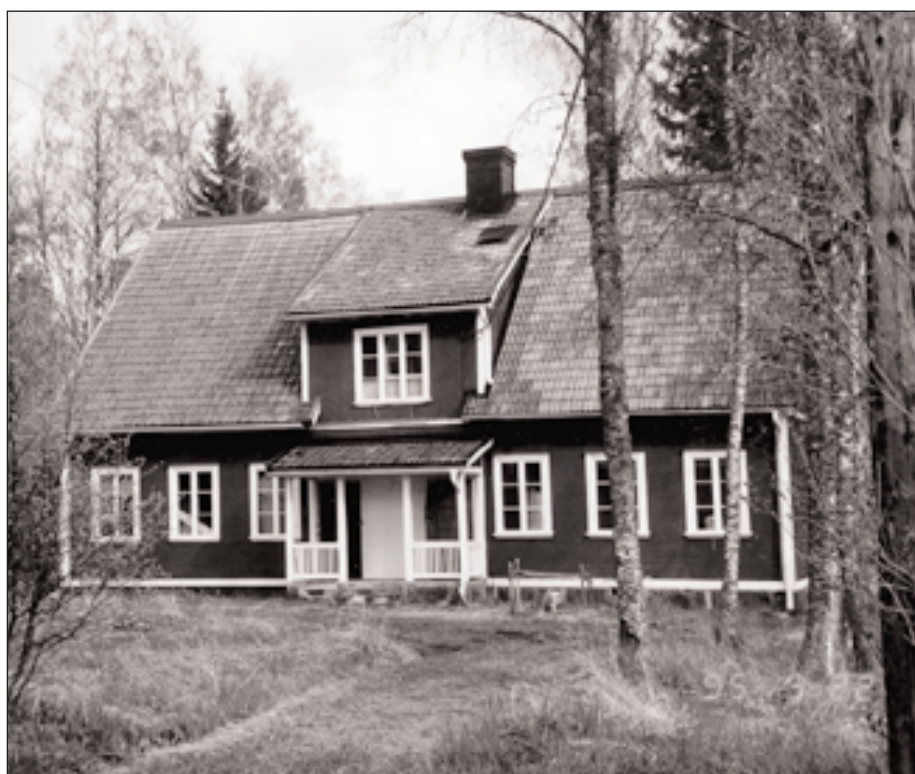
Svenska Vegetariska Föreningens kursgård, Järinge skola, Edebo socken i Roslagen.